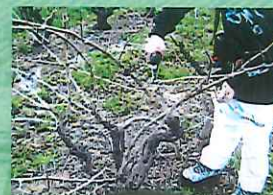
Formation sur le terrain