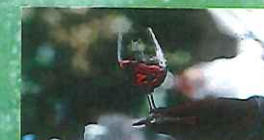
Apprentissage en dégustation des vins