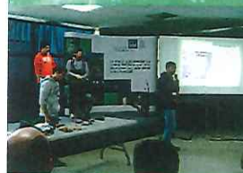
Participation aux concours régionaux