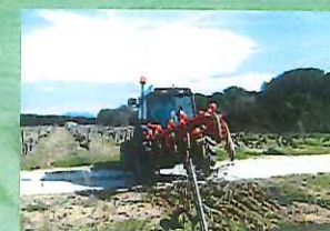
Visite dans des domaines