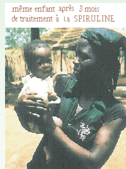
enfant sauvé après 3 mois de traitement à la spiruline

La spiruline contient toutes les protéines, vitamines, acide gras insaturés et minéraux dont nous avons besoin, une cuillère à soupe par jour suffit. C'est un excellent aliment pour lutter contre la malnutrition et qui peut être utilisé en urgence lors de catastrophes.